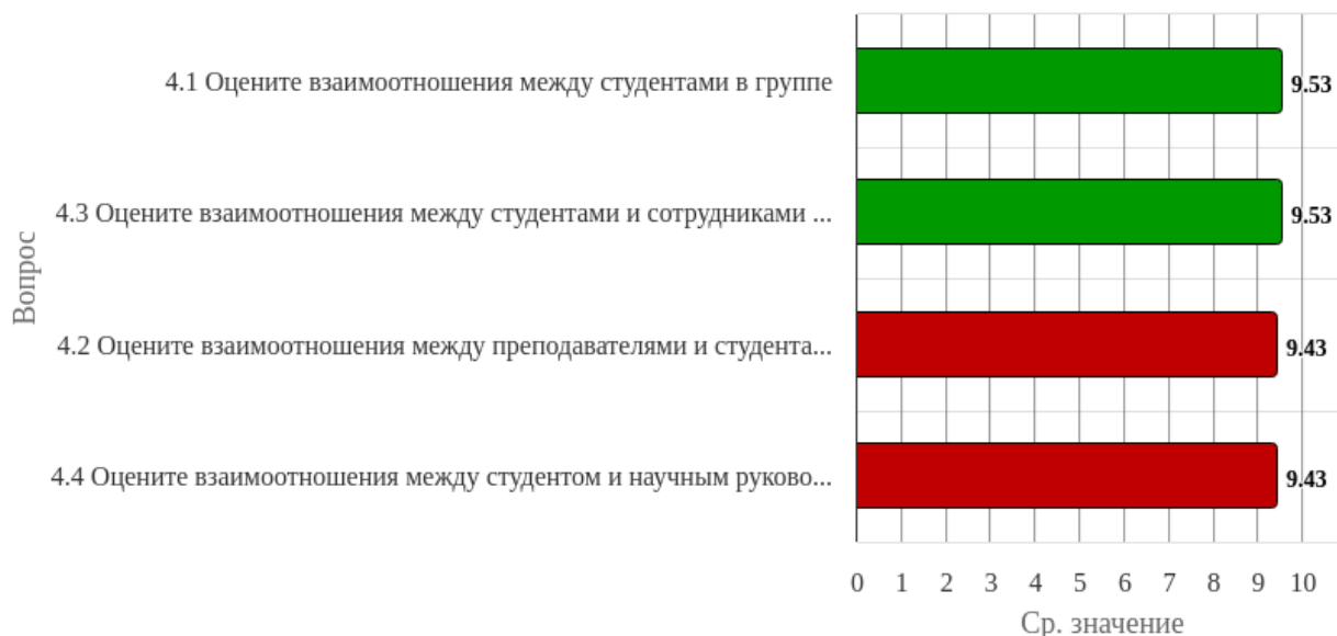
Рисунок 2.4.1 - Распределение показателей уровня удовлетворенности всех респондентов по блоку вопросов «Удовлетворенность взаимоотношениями в коллективе»

Индекс удовлетворенности по блоку вопросов «Удовлетворенность взаимоотношениями в коллективе» равен 9.48.